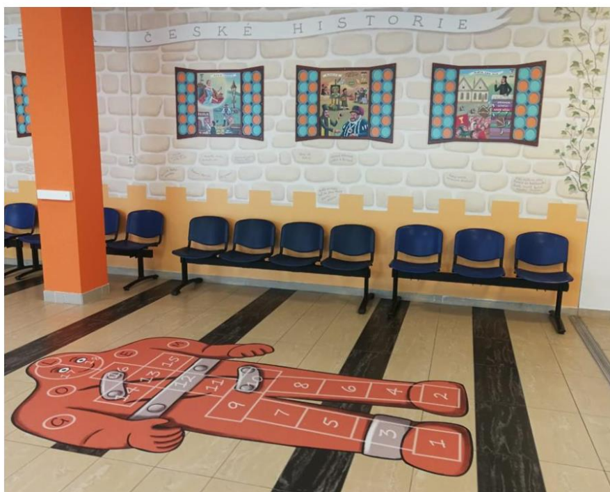
Obří třímetrový Golem dětem může sloužit jako skákaací panák a zároveň se zábavnou formou učí o naší historii.